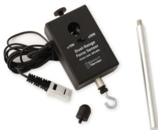
Obr. 3 Digitální siloměr Vernier DFS-BTA